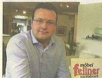
DI Fellner – Küchenaktion und City-Bonus

„Das Service-Paket von Möbel Fellner nimmt Ihnen für Ihre neue Küche alle Arbeiten ab: Vom Ausmessen zuhause über die perfekte Planung bis zur Realisierung durch Fachleute ist für alles gesorgt!“ Und das Beste daran: Diesen Service gibt es bei Möbel