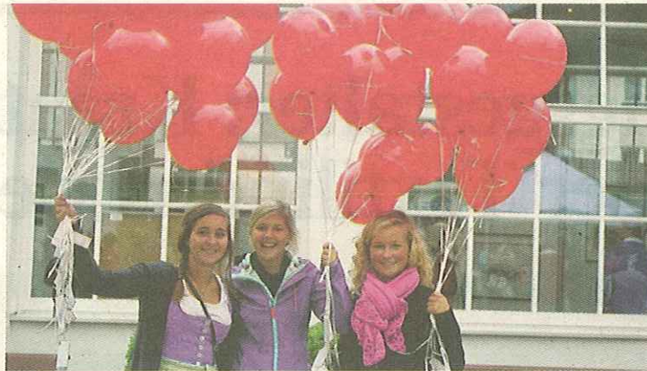
Zur Taufe des Kaiserstadt-Blogs ließ das Stadtmanagement Luftballons starten.