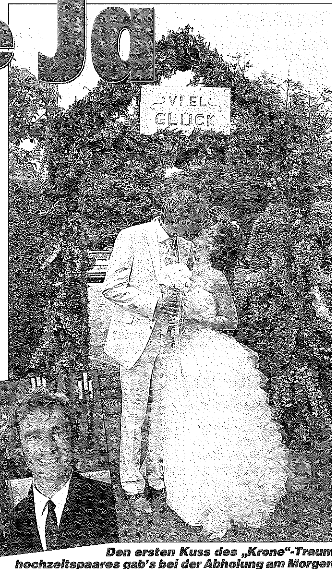
Den ersten Kuss des „Krone“-Traumphochzeitspaares gab's bei der Abholung am Morgen.