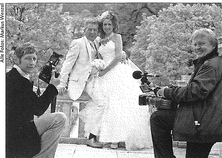
Fotograf Wolfgang Stadler und Filmer Patrice Bruvier hielten den ganzen Traumphochzeitstag lang alles fest.

„Das ist der schönste und emotionalste Tag meines Lebens!“ Braut Doris